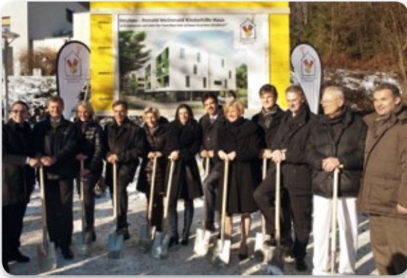
Spatenstich Ronald McDonald Haus Graz

Noch rechtzeitig vor Weihnachten fand am 12.12.2012 der Spatenstich für unser neues Haus am Gelände des Landeskrankenhauses Universitätsklinikum Graz statt. Nur 200 Meter von der Kinderklinik entfernt bieten zukünftig 15 Apartments mehr als doppelt so viel Platz für betroffene Familien. Helle Gemeinschaftsräume wie ein großes Spielzimmer, zwei Küchenzeilen, ein großer Essbereich sowie ein Loungebereich schaffen die Voraussetzungen für ein perfektes Miteinander.