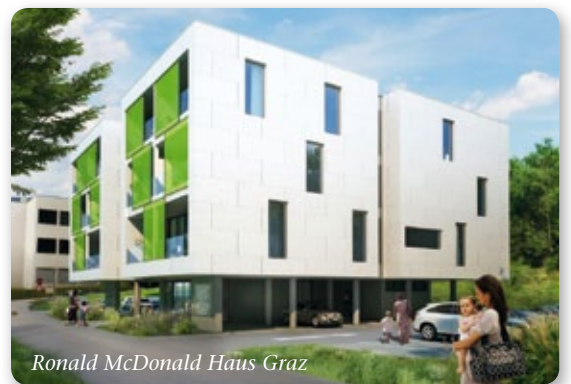
Ronald McDonald Haus Graz